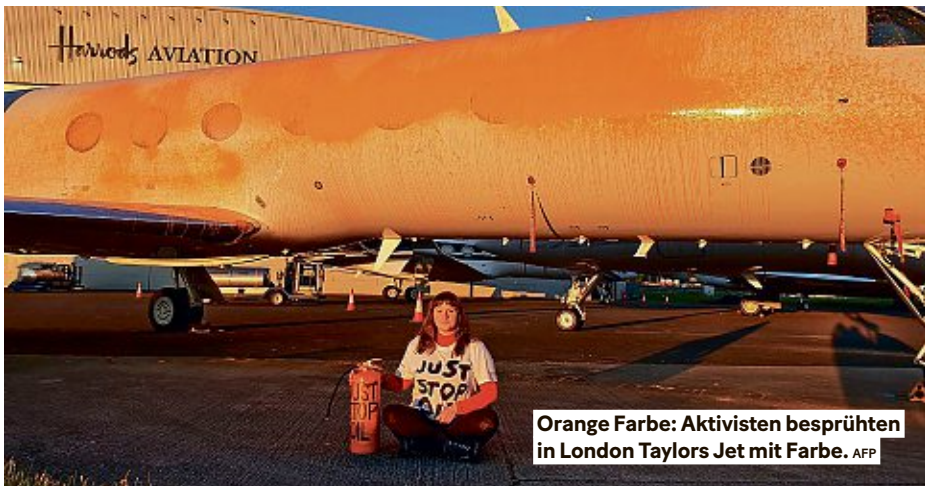
Orange Farbe: Aktivisten besprühten in London Taylors Jet mit Farbe.

sionen – jene der Shows selbst und der Fans, die angereist sind, noch gar nicht eingerechnet. Bis Dezember explodiert die Zahl. Um gegen Swifts Emissionen zu protestieren, haben Ende Juni Aktivisten der Klimagruppe Just Stop Oil ihren Privatjet in London mit oranger Farbe besprüht. 3300 Allein der sechstägige Stopp der Tour in Kalifornien hatte einen wirtschaftlichen Gesamteinfluss von 320 Millionen Dollar und schuf etwa 3300 Arbeitsplätze. 55000000 Techniker, Caterer, Tänzer und andere Mitarbeiter der Tour erhielten Prämien in Höhe von 55 Millionen Dollar. 93000000 Insgesamt geben die Fans bei jeder Show geschätzt 93 Millionen Dollar aus. 3000000 Mit dem Verkauf von Freundschaftsbändern auf Etsy von April bis August 2023 wurden laut US-Medien 3 Millionen Dollar umgesetzt. 3,5 Eine Show auf der Tour dauert im Schnitt 3,5 Stunden. KATRIN OFNER